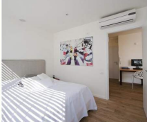
קירקס גם בחדר השינה | תלם קפסא אסטום

המעצבת השתמשה בתאורת קיר, שמאורה מרחבשה אל התקרה תאורת "אס דאן לייט" ובכך העקרה מראה נבונה יותר ומאפשרת לחדר להראות גדול יותר. בחדר שינה יש תאורה רחפנות תלויה לצד המטח.