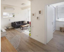
קיר ששפירד נקן חדר הטיסם למלון | תלם קפסא אסטום

למני השימוש חלל המגורים תיסקד כסלון וכחדר שינה לאחר השימוש נשנתה חלוקה של הדירה ל-2 חדרים. בתכנון סגן חדר הרחצה והאיתותם הענבה לצד הבית. סה שאסטור סיסול סגן בחלוקת החלל וזירת חדר שינה מוחו כולל ארון גדול וסלון מוחו משולב עם מטבח פתוח. כל מארזת ה"YES" והשטח המסותה בארון חדר השינה, כך שהסלון הוגדל על השבן ריהוט מוחת. רישוף גרניט מוחלן דמו סרקס הוחקו בכל הבית כולל בחדר הרחצה על מנת לתת לבית מראה אחד.