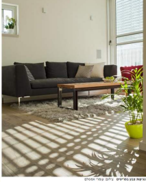
תלם קפסא ון תימים | תלם קפסא אסטום

בנוסף, האופנה הייתה להפוך את חלל המגורים המעור לבית מוחות, נעים ושיענה על כל המוקצות הנכונות לונג. על מנת למקסם את חלל הדירה באורה הטובה ביותר, היה צורך להחם את כל הקירות והבדועם שמשם נשח גדול במרפסה לבית. לא נשאר קיר אחד שאנה לפני כן, למעט הקירות החיצונים - נתקבל חלל נקי.