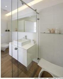
קירקס גם בחדר הרחצה | תלם קפסא אסטום

חדר הרחצה גדול יותר מבשאר, בו יש מקלחון גדול וארון כיר מוחף, כך שניתן לראות את הריפסה מסטיכה. במסוף תחלתה מראה גדולה מרוננה, לכל ארונס של הקיר על מנת להגדיל את החור.