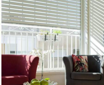
תלם קפסא ון תימים | תלם קפסא אסטום

בכל הבית השמשה המעצבת פשוטיות ילדות של דירי הבית, שימוש במשורטת מוסקה בזמן המלחות. כמו כן יש רסקוליס גם בחדר השינה וחדרת אודו בסלון.