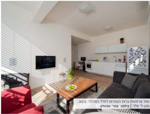
שתי מרפסות צרות הצטרפו לחלל המרכזי. עיצוב: נטע-לי פלד