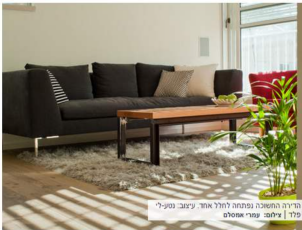
הדירה התאמה נפתחה לחלל אחד. עיצוב: נטע-לי פלד