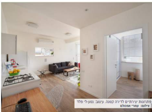
פתרונות יצירתיים לדירה קטנה. עיצוב: נטע-לי פלד

מטע הביקור: יום ה' (2.5), 17:00-20:00, יום ו' (3.5), 10:30-13:30, שבת (4.5) 11:00-14:00 כתובת: רחוב הקליר 21, קומה 3, דירה 10