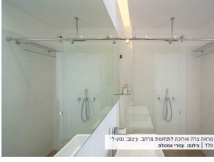
מראה צרה וארכה לתחושת מרחב. עיצוב: נטע-לי פלד