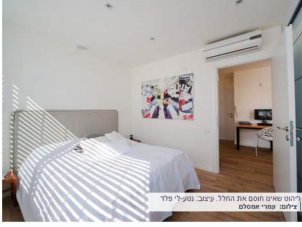
ריהוט שאינו חוסם את החלל. עיצוב: נטע-לי פלד